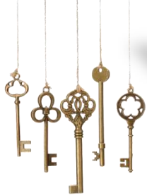
Схема проведения квеста